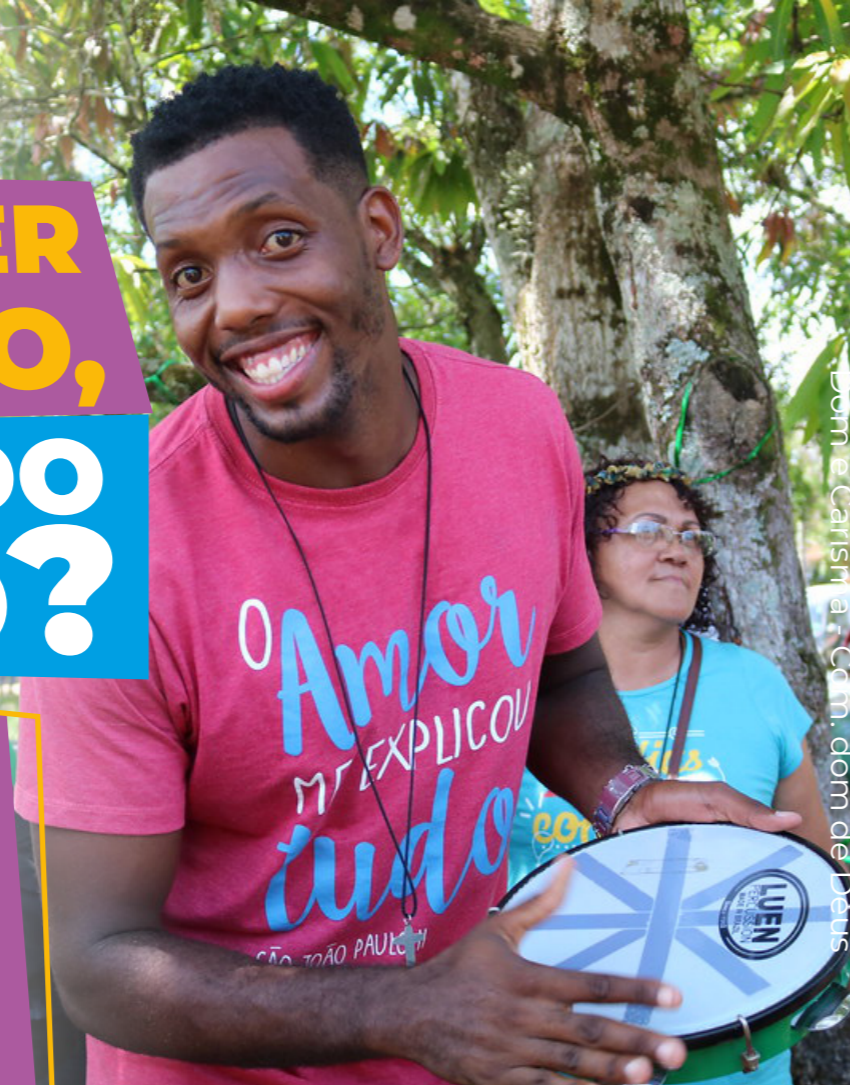
Dom e Carisma - Com. dom de Deus