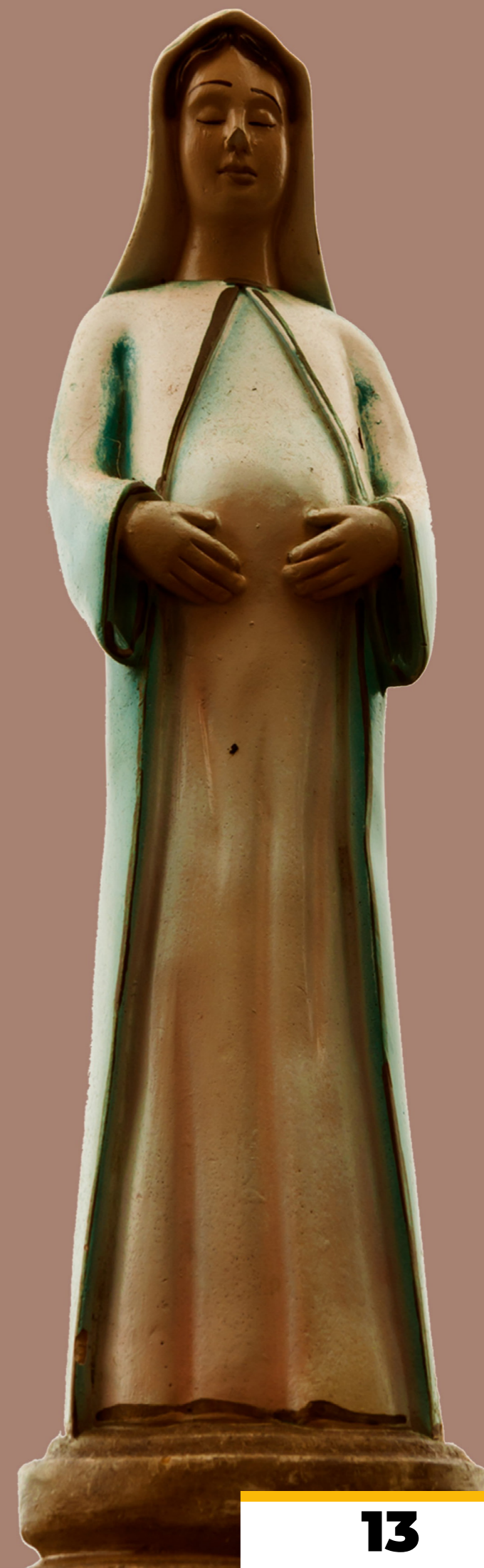
Revista digital Dom