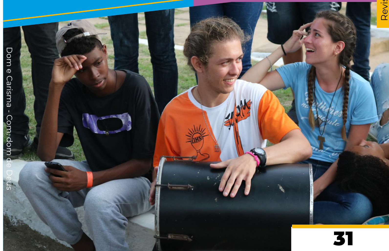
Dom e Carisma - Com. dom de Deus